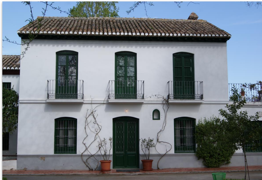
Muzeum w dawnej letniej rezydencji rodziny poety, park Federica Garcíi Lorki , Huerta de San Vicente, Granada.