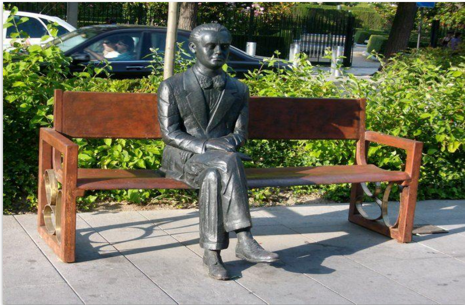
Rzeźba autorstwa Juana Antonio Corredora przedstawiająca siedzącego na ławce Lorke, Avenida de la Constitución, Granada.